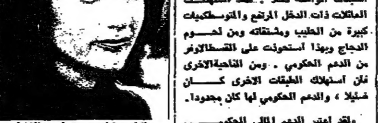
جاكين كينيدي : أين الناظور؟